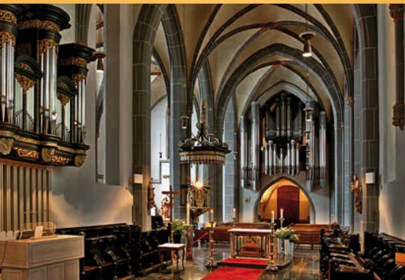
Lambertus Basiliek Düsseldorf