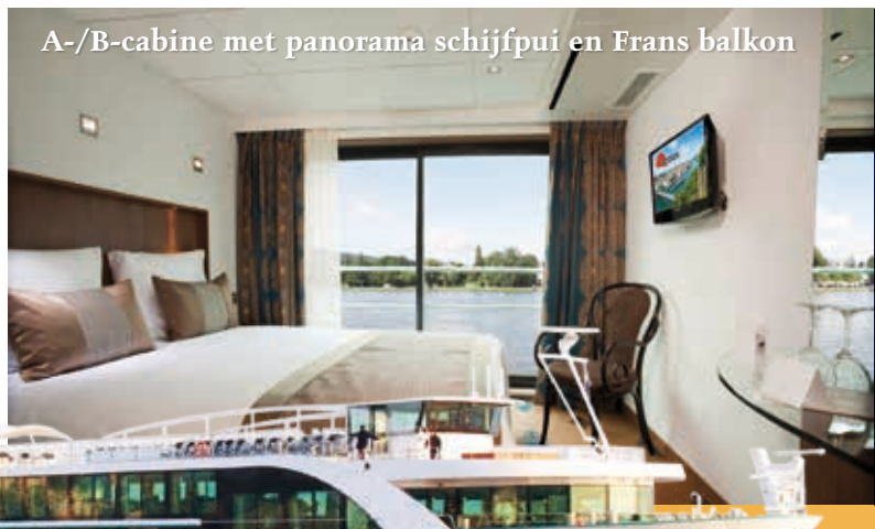
A-/B-cabine met panorama schijfpui en Frans balkon

Volpension aan boord! Inclusief alle ontbijtbuffetten, lunches en diners