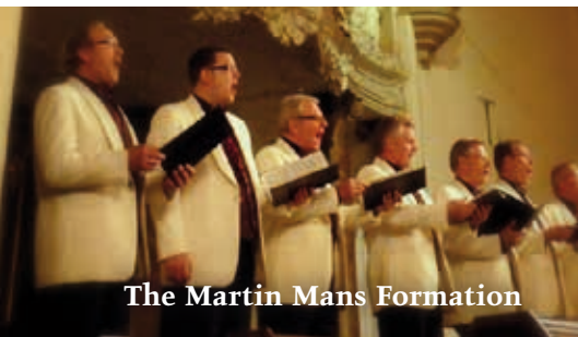
The Martin Mans Formation